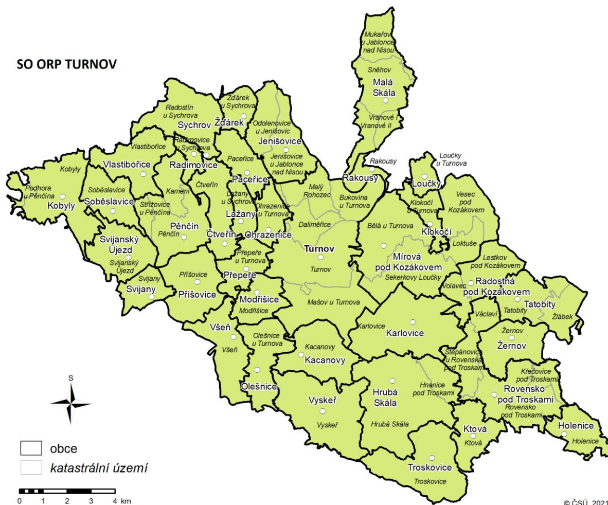
Mapa č. 1: Administrativní členění správního obvodu obce s rozšířenou působností Turnov k 1. 1. 2022

Správní obvod obce s rozšířenou působností (dále jen SO ORP) Turnov se rozkládá na jihu Libereckého kraje na území okresů Jablonec nad Nisou, Liberec a Semily. Sousedí v Libereckém kraji s SO ORP Jablonec nad Nisou, SO ORP Liberec, SO ORP Semily a SO ORP Železný Brod, ve Středočeském kraji s SO ORP Mnichovo Hradiště a v Královéhradeckém kraji s SO ORP Jičín. SO ORP Turnov tvoří 36 obcí (do konce roku 2020 to bylo 37 obcí, součástí byla obec Frýdštejn, která od roku 2021 spadá pod SO ORP Jablonec nad Nisou). Přirozeným centrem je Turnov, který jako jediný vykonává i agendu obce s pověřeným obecním úřadem. Ostatní jsou obce 1. typu. Statut města má i Rovensko pod Troskami. SO ORP má nyní rozlohu 232,64 km 2 , do konce roku 2020, byla rozloha 247,14 km 2 , tedy 7,8 % území Libereckého kraje.