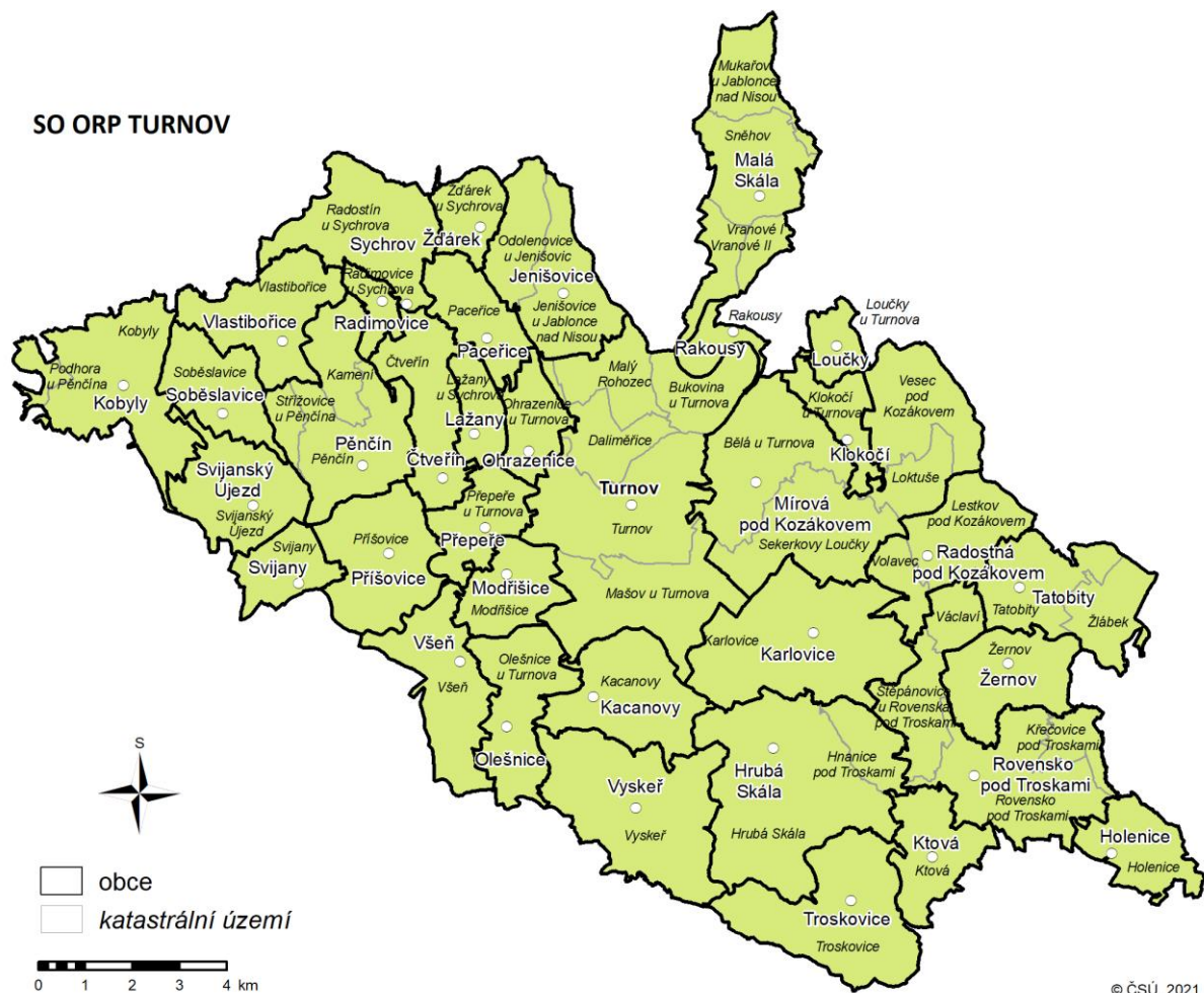
Mapa č. 1: Administrativní členění správního obvodu obce s rozšířenou působností Turnov k 1. 1. 2022

Správní obvod obce s rozšířenou působností (dále jen SO ORP) Turnov se rozkládá na jihu Libereckého kraje na území okresů Jablonec nad Nisou, Liberec a Semily. Sousedí v Libereckém kraji s SO ORP Jablonec nad Nisou, SO ORP Liberec, SO ORP Semily a SO ORP Železný Brod, ve Středočeském kraji s SO ORP Mnichovo Hradiště a v Královéhradeckém kraji s SO ORP Jičín. SO ORP Turnov tvoří 36 obcí (do konce roku 2020 to bylo 37 obcí, součástí byla obec Frýdštejn, která od roku 2021 spadá pod SO ORP Jablonec nad Nisou). Přirozeným centrem je Turnov, který jako jediný vykonává i agendu obce s pověřeným obecním úřadem. Ostatní jsou obce 1. typu. Statut města má i Rovensko pod Troskami. SO ORP má nyní rozlohu 232,64 km 2 , do konce roku 2020, byla rozloha 247,14 km 2 , tedy 7,8 % území Libereckého kraje.