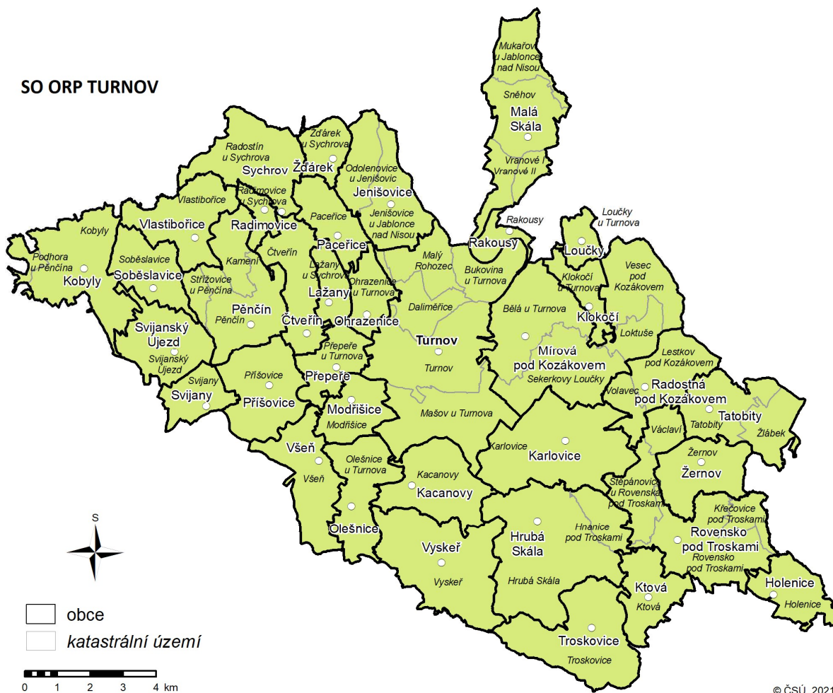
Mapa č. 1: Administrativní členění správního obvodu obce s rozšířenou působností Turnov k 1. 1. 2022

Správní obvod obce s rozšířenou působností (dále jen SO ORP) Turnov se rozkládá na jihu Libereckého kraje na území okresů Jablonec nad Nisou, Liberec a Semily. Sousedí v Libereckém kraji s SO ORP Jablonec nad Nisou, SO ORP Liberec, SO ORP Semily a SO ORP Železný Brod, ve Středočeském kraji s SO ORP Mnichovo Hradiště a v Královéhradeckém kraji s SO ORP Jičín. SO ORP Turnov tvoří 36 obcí (do konce roku 2020 to bylo 37 obcí, součástí byla obec Frýdštejn, která od roku 2021 spadá pod SO ORP Jablonec nad Nisou). Přirozeným centrem je Turnov, který jako jediný vykonává i agendu obce s pověřeným obecním úřadem. Ostatní jsou obce 1. typu. Statut města má i Rovensko pod Troskami. SO ORP má nyní rozlohu 232,64 km 2 , do konce roku 2020, byla rozloha 247,14 km 2 , tedy 7,8 % území Libereckého kraje.